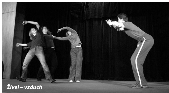
Živel – vzduch