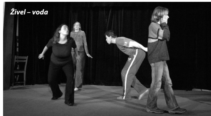
Živel – voda

Oheň, voda, vzduch a země – tyto čtyři živly nás zaměstnávaly po celou divadelní dílnu. Na jevišti žhnuly žhavé uhlíky, po imaginárním okně stékaly kapky deště, proudění vzduchu nás zase inspirovalo k ztvárnění boje s větrem o čepici. I v jednoduchosti je krása, jak nás přesvědčil minimalistický kapr a montypythonovské hrátky s gravitací.